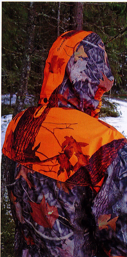
Huppu on ehdoton varuste. Se on irrotettava ja säädettävä.

Itse asiassa housunnapin korvaaminen pitkällä tarralla on nerokas. Eipä kiristä liitinki jos tulee makkaraa syötyä vähän liikaa tai päällä on paksumpi villapaita ja välihouset. Tarrojen haittapuoli on se, että ne pitävät ääntä. Kuulaassa syyssäässä tarranauhan repivä rusahdus kantaa kirkolta kotiin ja vielä jäniksen korviinkin. Eli passissa niitä ei kannata repiä. Housujen vyötärö on joustava. Housuissa on reisitaskut, henkseille napit ja perstasku.