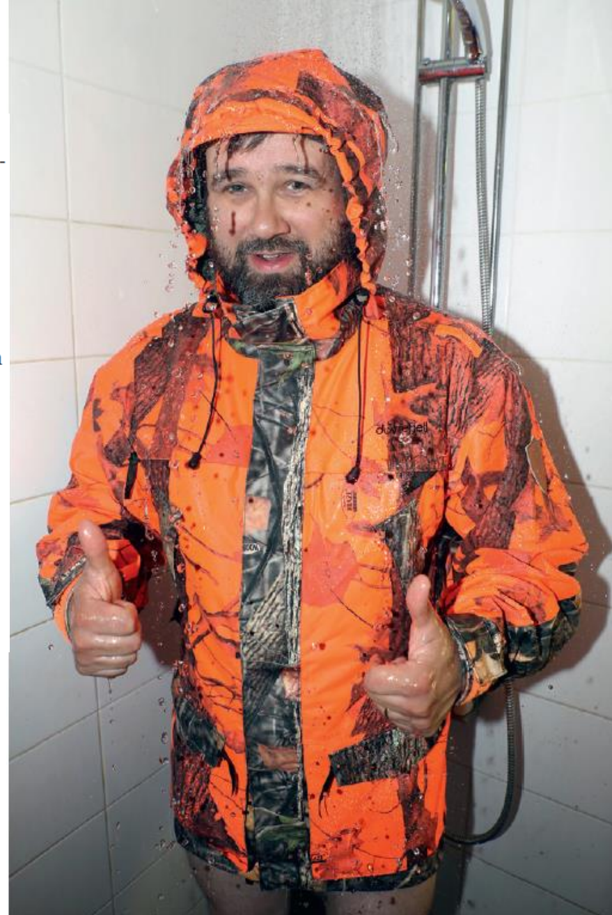
Tuotteiden kankaiden vedenhylkivyyttä testattiin kahden minuutin suihkulla. Kankaisiin imeytyvät vesimäärät vaihtelivat 50 ja 780 gramman välillä.

Valmistajat ilmoittavat kalvoilleen huikeita hengittävyyslukemia eli kuinka paljon vesihöyryä pääsee kankaan läpi vuorokaudessa. Näillä lukemilla ei ole todellisen käytön kanssa juuri mitään tekemistä, sillä esimerkiksi pintakankaisiin imeytyvä vesi tukkii hengittävyuden.